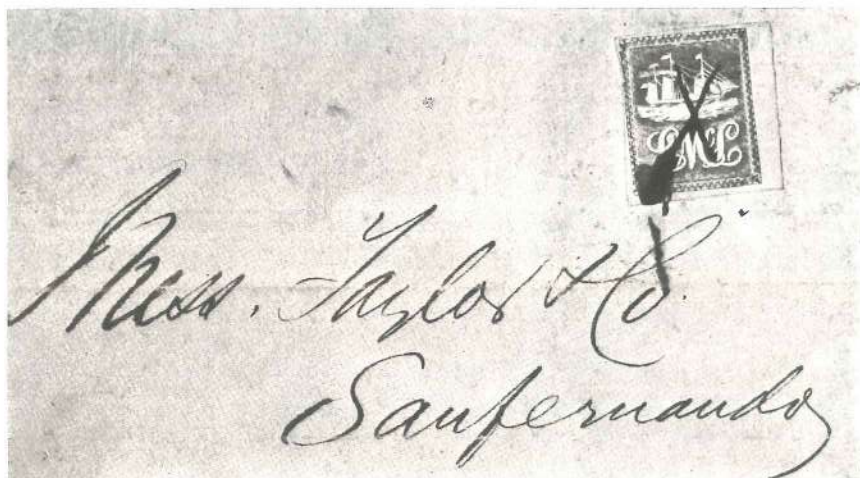
Trinidad, 1847: carta expedida desde Puerto España a San Fernando, franqueada con un sello al que se denomina «Lady McLeod», nombre del buque que efectuaba la travesía entre los dos puertos. Los sellos eran matasellados a pluma.