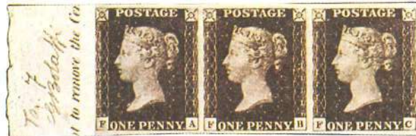
Del penny negro al penny rojo. En el primer sello del mundo, negro (del que se reproduce una tira de tres con margen borde de hoja), el matasellado resultaba apenas visible.

El ejemplo inglés encontró sus primeros imitadores en Suiza y más concretamente en el cantón de Zurich. El 21 de enero de 1843, el Consejo de Estado de esa ciudad aprobaba una reforma del servicio postal del cantón, inspirada en el modelo inglés. Se establecían tres tarifas: 4 céntimos (o