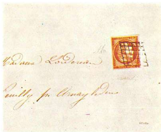
imagen de tres cuartos de perfil, por lo que, las charreteras de su uniforme quedaban en primerísimo plano; también por entonces aparecen los primeros sellos de Francia, con el perfil de la diosa Ceres. Los primeros sellos que se usaron en territorio italiano fueron precisamente esas «Ceres»: las

adoptaron ya en 1849 las tropas francesas que estaban acantonadas en el Estado Pontificio y tenían sus cuarteles en Civitavecchia y en Roma. Habrían de transcurrir otros diez años antes de que los sellos se difundieran en todo el territorio italiano.